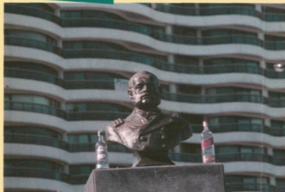
Los héroes no lloran pero tienen sus debilidades. Estatua del comandante Grau frente a Kibón.